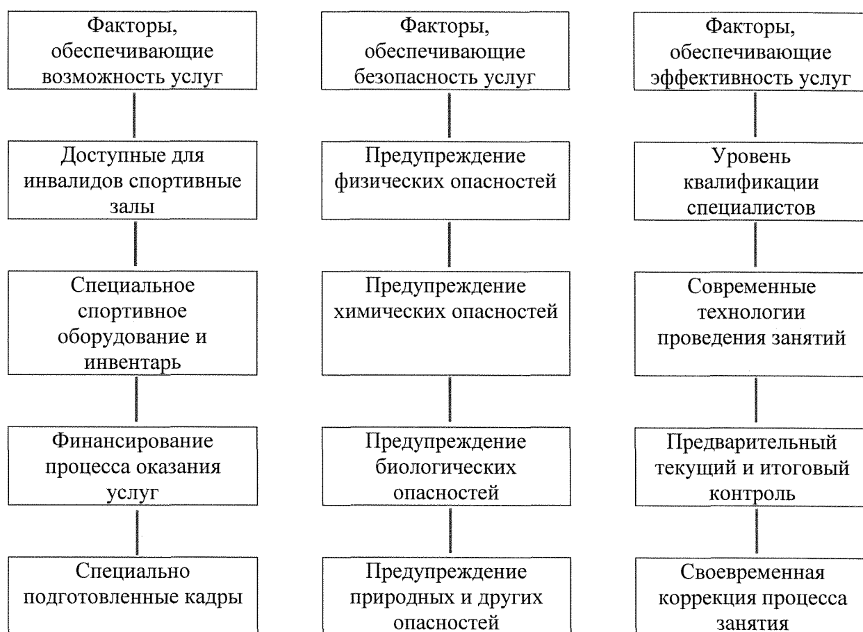
Рисунок 1. Факторы, влияющие на доступность услуг для инвалидов и других маломобильных групп населения на объектах спорта и в учреждениях и организациях, предоставляющих услуги

Понятно, что для обеспечения возможности предоставления и получения услуг для инвалидов и МГН необходимо наличие кадров, имеющих право работать с данным контингентом.